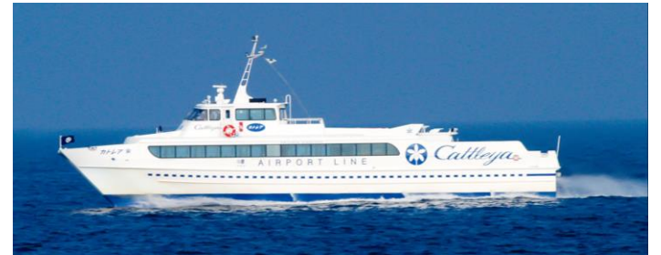
高速船のコースライン(コースは風や波で変わります)